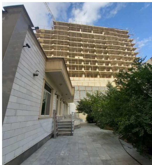
شکل ۴- احداث مرکز خرید درشت مقیاس و ناسازگار در مجاورت خانه‌های ویلایی و تاثیر و ضرر و خسارت به املاک مجاور از لحاظ اشرافیت و سایه-

حتی مالکان بعدی نیز حق شکایت ندارند، بدین شکل، تخلف ساختمانی و ضرر سایه‌اندازی و اشرافیت شکل قانونی پیدا کرده و ساختمان دارای پایان کار و سند می‌شود.