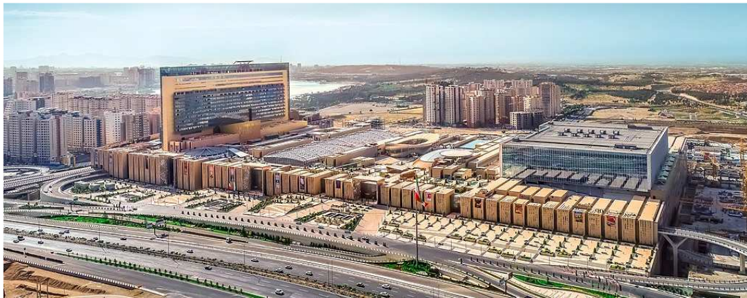
شکل ۱- مرکز خرید درشت مقیاس و ناسازگار ایران مال تهران

از مصادیق این نوع ضرر می‌توان به برخی برج‌ها یا بناهای بلندمرتبه‌ای اشاره نمود که ضررهایی را به سائرین وارد می‌نمایند. از جمله این ضررها می‌توان به کاهش رونق یا تعطیلی خرده‌فروشی‌های پیرامون مگامالها یا مراکز خرید اشاره نمود و یا کاهش ارزش ملک ناشی از شلوغی‌ها و بار ترافیکی مضاعف، سایه‌اندازی و اشرافیت این برج‌ها به بناهای مجاور نیز قابل ذکر است، بطوری که در برخی موارد، املاک پیرامون از حیظ انتفاع و سکونت خارج می‌شود.