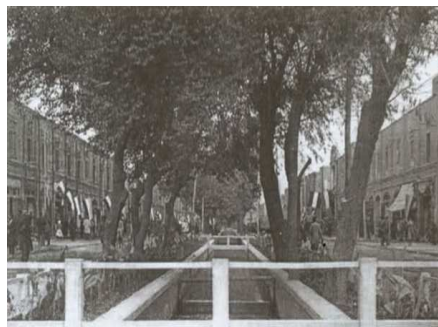
تصویر ۲: جوی آب بالا خیابان، ۱۳۱۵ هجری شمسی

مهم‌ترین اقدام شاه‌عباس در شهر مشهد احداث خیابانی مستقیم بوده است. این خیابان که از دروازه بالا خیابان به دروازه پایین خیابان می‌رسد در میانه راه به حرم مطهر می‌رسد، احداث جوی آبی که از حرم مطهر می‌گذشت و پهنه‌ای از درختان بلند قامت در میانه خیابان و در محور نشانی از باغ‌های ایرانی داشت که علاوه بر تأمین آب منطقه از آن به‌عنوان گردشگری نیز استفاده می‌شده است. در سال ۱۳۴۵ شهرداری با قطع درختان دو طرف نهر روی آن را پوشانید بالا خیابان و پایین خیابان از حالت چهارباغ که ریشه در تاریخ کهن مشهد داشت خارج شد. (حقیقت‌بین و همکاران، ۱۳۸۸).