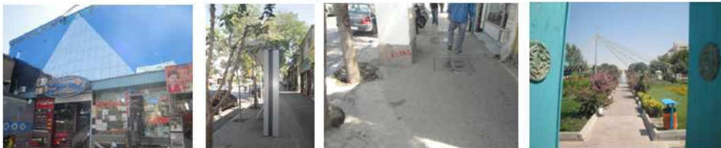
(تصویر ۶، ۷، ۸) نقاط ضعف مسیر