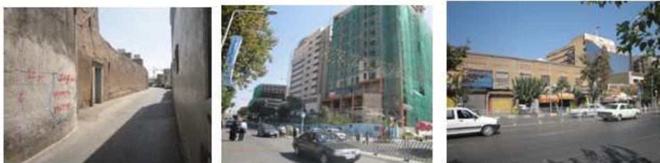
(تصویر ۹، ۱۰، ۱۱) نقاط ضعف مسیر