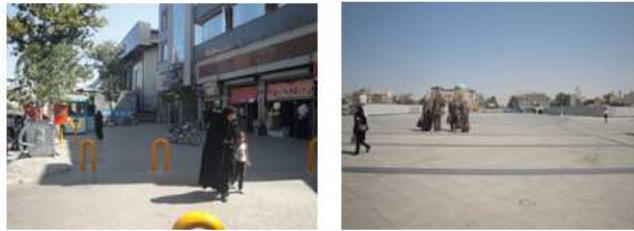
(تصویر ۱۳، ۱۲) نقاط ضعف مسیر

قبل از تبیین برداشت‌های میدانی و پرسشنامه‌ها در قالب جدول SWOT بایستی ارزش محور تعیین گردد تا بتوان راهکارهایی جدی را در همان زمینه ارائه داد.