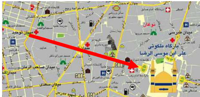
تصویر ۱: نقشه شهری مشهد

در ادامه یکی از محورهای منتهی به حرم مطهر امام رضا (ع) یعنی محور از فلکه توحید با نام قدیمی دروازه قوچان به سمت حرم مطهر (بالا خیابان) که در این مسیر میدان بزرگ شهدا، باغ نادری، مدارس حوزه علمیه و دیگر بناها و خیابان‌های منتهی به این مسیر است، در شهر مشهد در ادوار مختلف سلسله‌های گوناگون که می‌خواستند به‌ظاهر پیوندشان را با مذاهب حفظ نمایند، به ساختن این آثار و با تعمیرات و ملحقاتی در اطراف حرم مطهر پرداخته‌اند، که از موارد قابل توجه می‌باشد مورد بررسی قرار می‌گیرد. در رأس این بناها حرم مطهر می‌باشد که کانون تلقی شده و عاملی برای به وجود آمدن این محور می‌باشد.