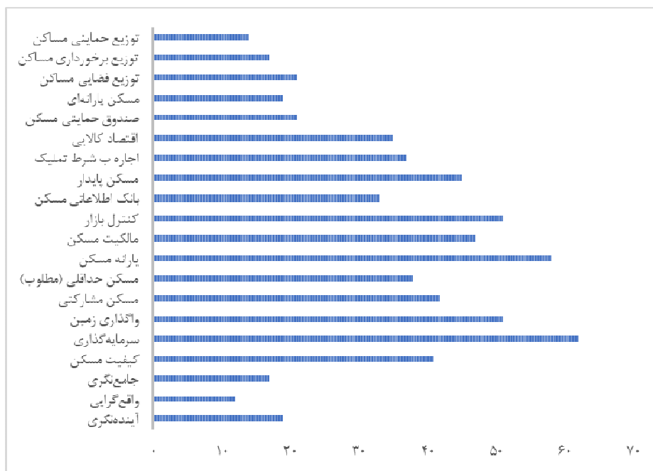
شکل ۳: ارزیابی مطالعات نظام‌مند انجام‌شده در حوزه سیاست‌گذاری و نابرابری فضایی مسکن