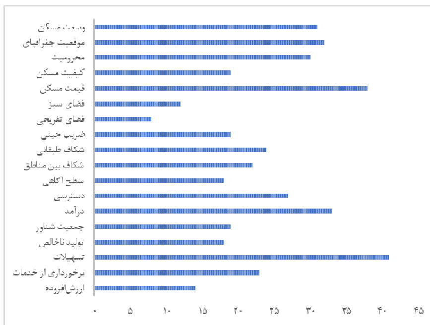
شکل ۲: مؤلفه‌ها و مقالات استخراجی در حوزه نابرابری فضایی مسکن